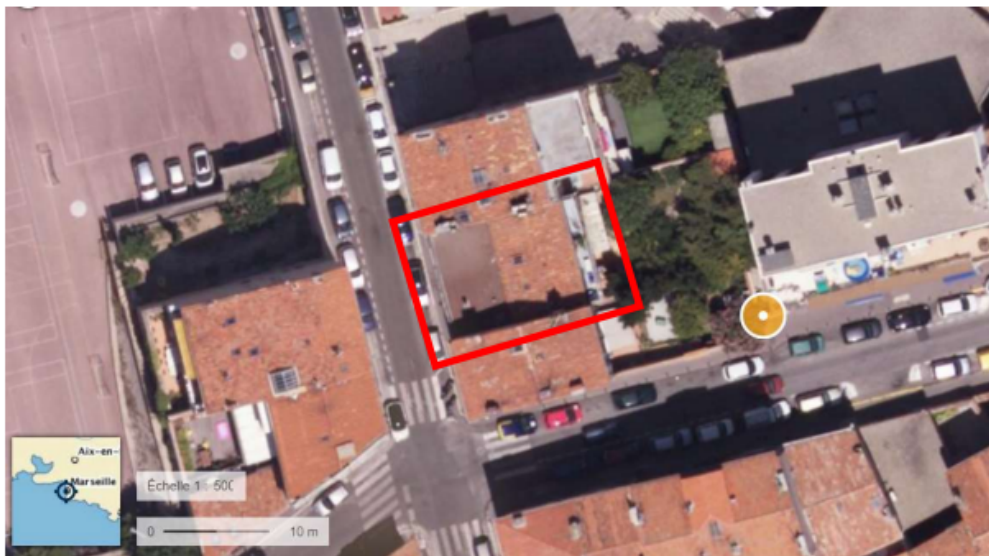
Figure 2: Localisation aérienne de l'immeuble